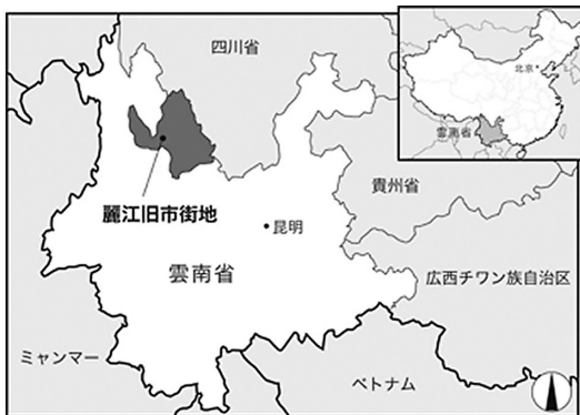
図1 麗江旧市街地の位置

尚、筆者らが2003年より麗江旧市街地に対する現地調査を開始する以前において、麗江旧市街地の伝統的民家や町並みを対象とした国内外の主要な研究には、例えば文献8～11)があり、筆者らのこれまでに一連の研究は、当該先行研究を踏襲した上で行ってきたものである。