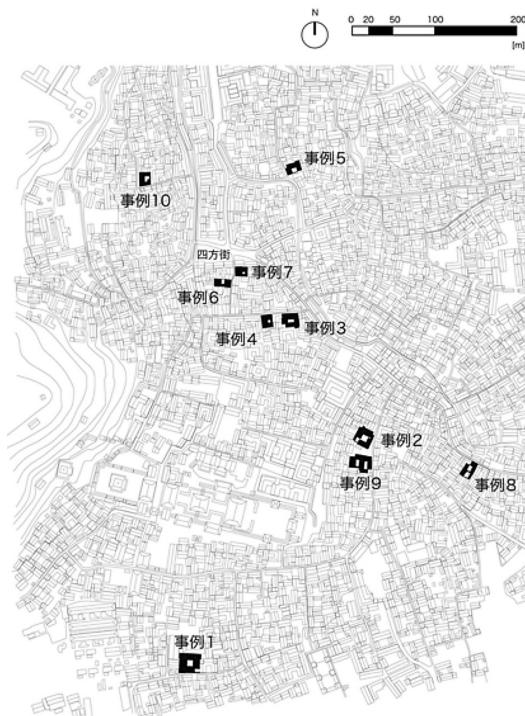
図3 調査事例の場所

(文献4)「表2：民家の用途の変容」の内容に、2017年時の調査結果を加えて(表1)にまとめた。(表1)より、2017年時において、調査対象民家の22件の内、従前において本来の使用用途であった専用住宅として使用されている事例は、百歳坊56の1事例 注7) であり、四方街17の建替工事中事例、密士巷74の空き家事例 注8) 、並びに、百歳坊33の市