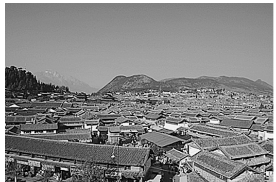
写真1 麗江旧市街地鳥瞰